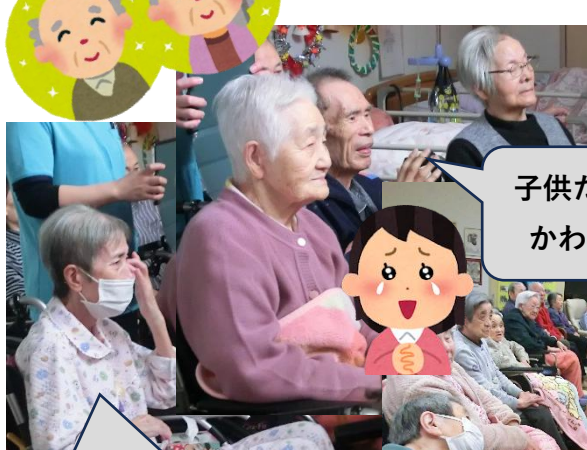
子供たちの姿、 かわいいなあ