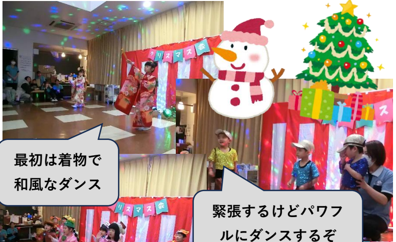
最初は着物で 和風なダンス