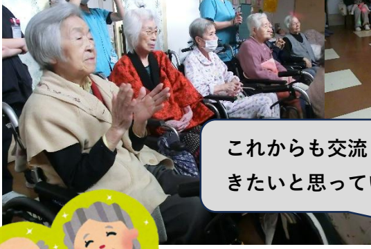
これからも交流してい きたいと思っています