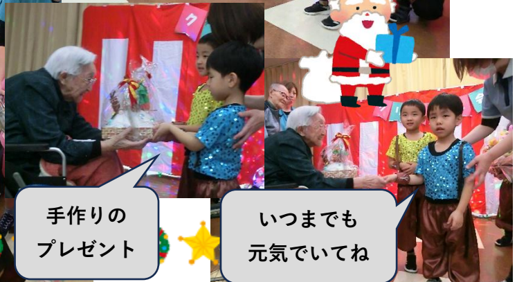
手作りの プレゼント