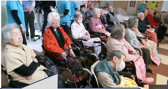
年齢別のダンスに真剣な眼差しで 見守る入居者の皆さん

協力してくれた“こども園 長橋”の皆さんに感謝し、これからも交流していきたいと思っています。