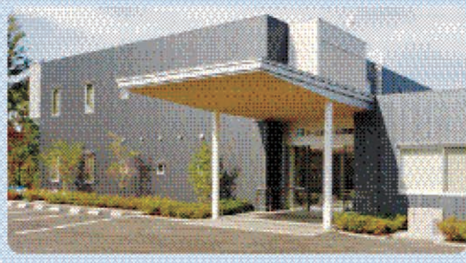
住宅型有料老人ホームとは、高齢者向けの生活関連のサービスの提供に特化した居住施設です。入所者自身で介護サービスを選択し、施設での生活することになります。個人のプランによって介護サービスを受ける必要があり、利用した分だけの料金を支払うことになります。