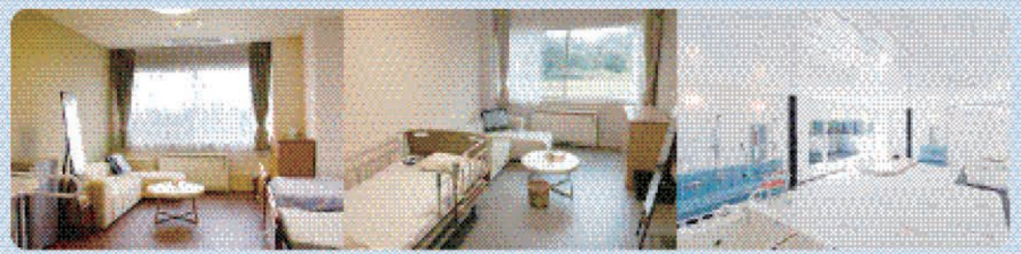
特別居室 ご夫婦などお二人でのご入居も可能な特別居室。(※写真はイメージです。) 一般居室 お一人様用居室。(※写真はイメージです。) 大浴室 広々と快適な大浴室。大きな窓からは暖かい日光が差し込みます。機械浴もご利用いただけます。