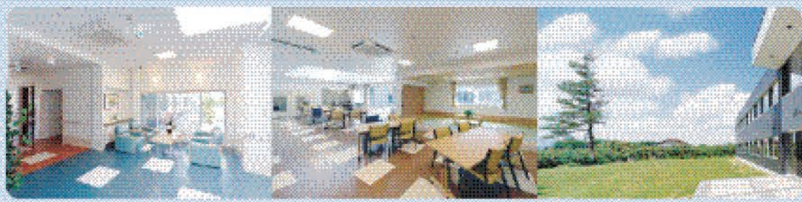
ロビー 開放的なロビーにて、お客様をお迎えいたします。 デイサービスルーム・食堂 ゆったりとくつろげる広々とした空間。 庭 四季を感じる風景があります。